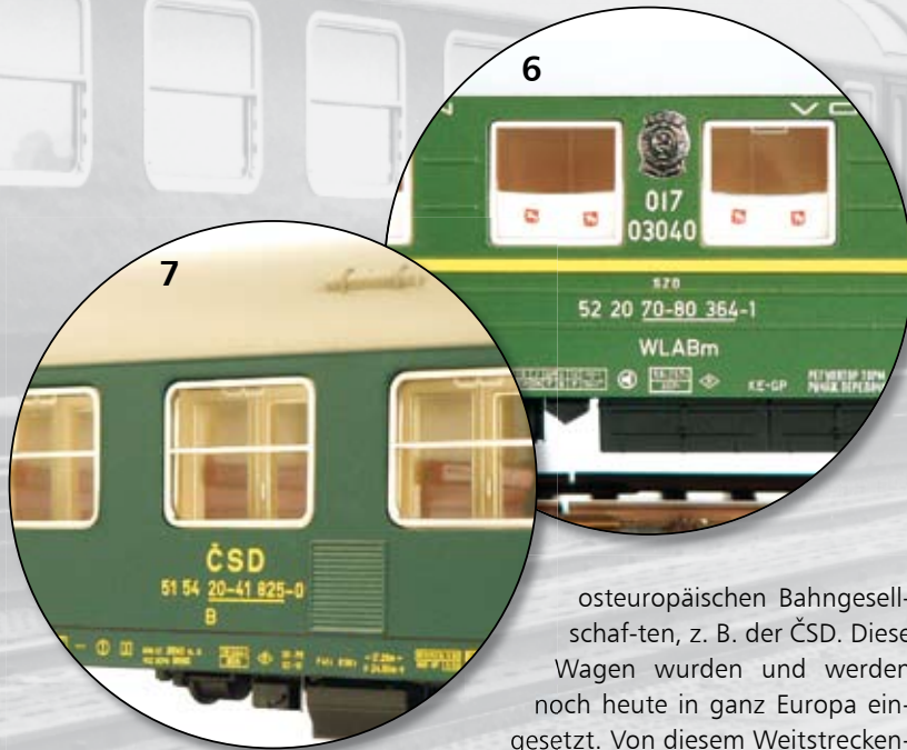
Bild 6 und 7: Der RIC-Weitstreckenschlafwagen WLABm (Abb. zeigt TILLIG-H0-Modell) sowie ein Y-Wagen der ČSD (Abb. zeigt H0-Modell des Typs Y/B 70).