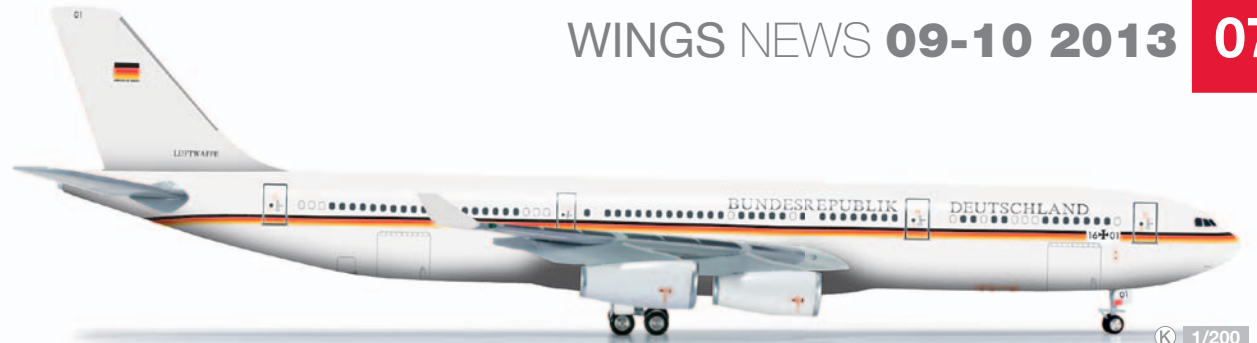
555968 65,00 € Luftwaffe Flugbereitschaft Airbus A340-300 - 16*01 Zwei von der Lufthansa übernommene, runderneuerte und speziell ausgestattete A340 sorgen für die weltweite Beförderung der politischen Führung Deutschlands sowie für begleitende Journalisten, Wirtschaftsverteter oder Staatsgäste. Die erste A340 ist nach dem ersten Bundeskanzler Konrad Adenauer benannt. / Two refurbished and specially equipped ex-Lufthansa A340s are responsible for transporting Germany's political leaders, as well as accompanying journalists, representatives of business or state guests around the world. This first A340 is named after the first chancellor of West Germany, Konrad Adenauer.