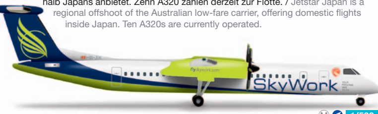
524377 M 1/500 19,00 €

Jetstar Japan Airbus A320 – JA01JJ Jetstar Japan ist ein regionaler Ableger der australischen Airline, die günstige Flüge innerhalb Japans anbietet. Zehn A320 zählen derzeit zur Flotte. / Jetstar Japan is a regional offshoot of the Australian low-fare carrier, offering domestic flights inside Japan. Ten A320s are currently operated.