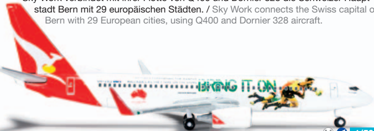
526128 M 1/500 22,00 €

Sky Work Airlines Bombardier Q400 – HB-JIK Sky Work verbindet mit ihrer Flotte von Q400 und Dornier 328 die Schweizer Hauptstadt Bern mit 29 europäischen Städten. / Sky Work connects the Swiss capital of Bern with 29 European cities, using Q400 and Dornier 328 aircraft.