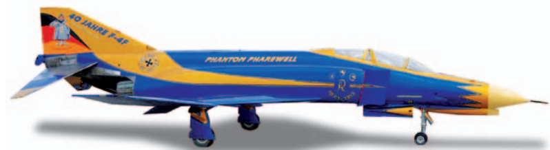
556033 32,00 € Luftwaffe McDonnell Douglas F-4F Phantom II JG71 „R“ - „Phantom Pharewell“ Am 29. Juni geht ein 40-jähriges Kapitel bei der deutschen Luftwaffe zu Ende: Als letztes Phantom-Geschwader rüstet das Jagdgeschwader 71 aus Wittmund nun auch auf den Eurofighter um. Den Feierlichkeiten entsprechend wird diese F-4 in Blau- und Goldmetall lackiert, mit der "Hartmann-Tulpe" am Bug und einer deutschen Variante des Phantom-Maskottchens am Leitwerk. / On June 29 th , a 40-year chapter of the German Air Force comes to an end: Fighter Wing 71, Germany's last remaining Phantom unit, will convert to the Eurofighter. For these celebrations, this F-4 has been painted in a special blue and gold metallic design, with the "Hartmann Tulip" around its nose and a "germanized" version of the Phantom mascot on the stabilizer.