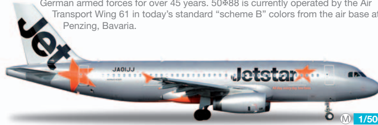
524438 M 1/500 22,00 €

Luftwaffe Transall C-160 LTG 61 – 50*88 Schon seit 45 Jahren ist die Transall C-160 im Dienst bei der Bundeswehr. Aktuell befindet sich die 50*88 in der heutigen Schema B-Tarnbemalung beim Luftransportgeschwader 61 im bayerischen Penzing im Einsatz. / The Transall C-160 has been in service with the German armed forces for over 45 years. 50*88 is currently operated by the Air Transport Wing 61 in today's standard "scheme B" colors from the air base at Penzing, Bavaria.