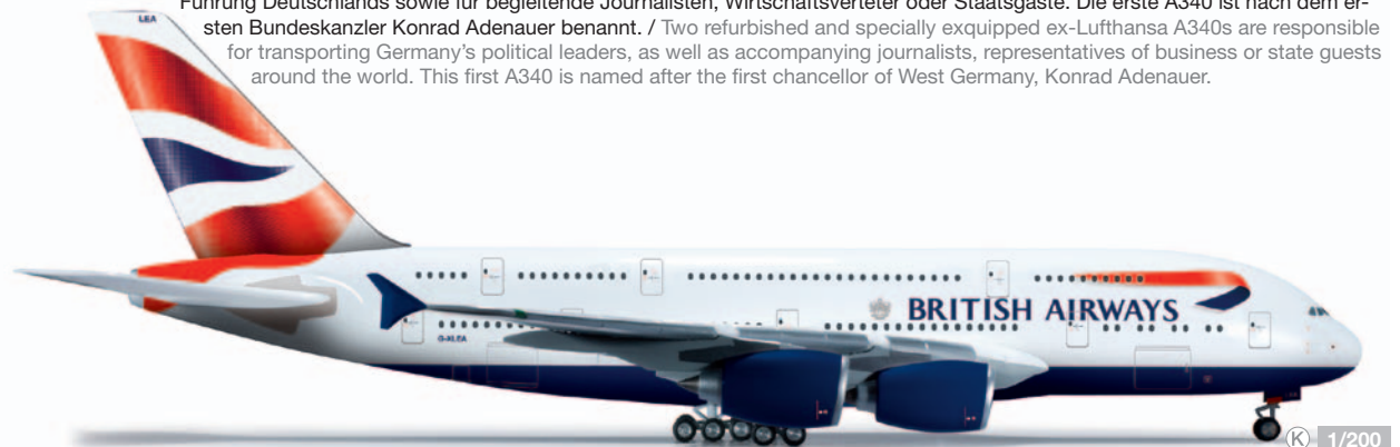
556040 72,00 € British Airways Airbus A380 - G-XLEA Als erste A380 soll G-XLEA nach eingehendem Training der Mitarbeiter ab Oktober den Liniendienst von London nach Los Angeles antreten. Der neue Superjumbo wird einige der betagteren Boeing 747 in der Flotte ablösen. / As BA's first A380, G-XLEA will inaugurate scheduled service from London to Los Angeles by October, following extensive training of the crews. The new super jumbo will replace some of the older Boeing 747 still in the fleet.