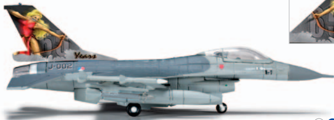
556064 32,00 € Royal Netherlands Air Force Lockheed Martin F-16AM Fighting Falcon, 323 rd Squadron „Diana“ 65 th Anniversary - J-002 Pünktlich zum 65. Jubiläum der 323. Staffel erscheint eine neue Sonderbemalung mit der überlebensgroßen römischen Jagdgöttin Diana am Leitwerk. / On the occasion of this year's 65 th anniversary of the 323 rd Squadron, a new special scheme with a larger-than-life image of the Roman goddess of the hunt, Diana, on the stabilizer was created by the unit.