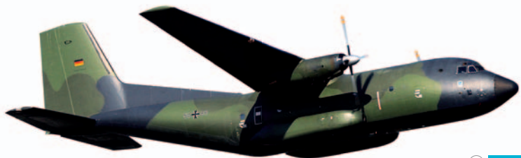
526111 M 1/500 24,00 €

Luftwaffe Transall C-160 LTG 61 – 50*88 Schon seit 45 Jahren ist die Transall C-160 im Dienst bei der Bundeswehr. Aktuell befindet sich die 50*88 in der heutigen Schema B-Tarnbemalung beim Luftransportgeschwader 61 im bayerischen Penzing im Einsatz. / The Transall C-160 has been in service with the German armed forces for over 45 years. 50*88 is currently operated by the Air Transport Wing 61 in today's standard "scheme B" colors from the air base at Penzing, Bavaria.