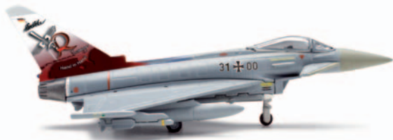
556026 32,00 € Luftwaffe Eurofighter Typhoon JaboG 31 „Boelcke“ - 55 th Anniversary - 31*00 Zwei Sonderlackierungen in einem: Auf der linken Leitwerksseite feiert das JaboG 31, benannt nach dem Fliegerass Oswald Boelcke sein 55-jähriges Bestehen. Auf der Rechten wird auf die Integration des Jagdgeschwaders 71 in das neu aufgestellte „Taktische Luftwaffengeschwader 31“ aufmerksam gemacht. / Two special schemes in one: on the left side of the rudder, the 31 st Fighter-Bomber Wing, named in honor of the WWI ace Oswald Boelcke, celebrates its 55 th anniversary. On the right, the integration of the 71 st Fighter Wing into the newly formed 31 st Tactical Air Force Wing is commemorated.