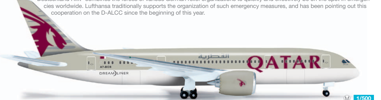
526135 M 1/500 26,00 €

Lufthansa Cargo McDonnell Douglas MD-11F „Aktion Deutschland Hilft“ – D-ALCC Der gemeinnützige Verein „Aktion Deutschland Hilft“ bündelt die Kräfte verschiedener deutscher Hilfsorganisationen, um in weltweiten Katastrophenfällen schnell und wirksam zur Stelle zu sein. Lufthansa unterstützt traditionell die Organisation solcher Hilfsmaßnahmen und macht seit Anfang des Jahres auf diese Zusammenarbeit auf der unter D-ALCC registrierten MD-11F aufmerksam. / The non-profit association "Aktion Deutschland Hilft" combines the forces of various German relief organizations to quickly and effectively be on the spot in emergencies worldwide. Lufthansa traditionally supports the organization of such emergency measures, and has been pointing out this cooperation on the D-ALCC since the beginning of this year.