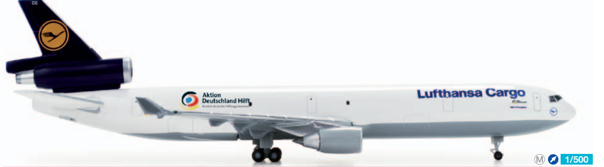
526104 M 1/500 26,00 €

China Eastern Yunnan Airlines Airbus A330-300 „Peacock“ – B-6128 2003 übernahm China Eastern die kleinere in der gleichnamigen Provinz beheimatete Yunnan Airlines. Als Unterabteilung der China Eastern existiert diese Gesellschaft auch weiterhin. B-6128 trägt ein frohes Farbenkleid mit der Darstellung von Pfauenfedern, in Erinnerung an das alte Logo der Yunnan Airlines. / In 2003, China Eastern took over the smaller Yunnan Airlines based in the province of the same name. The company still exists as a subdivision of China Eastern. B-6128 features a colorful livery of peacock's feathers in remembrance of Yunnan Airlines' old logo.