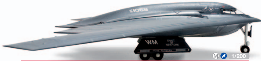
556019 49,50 € USAF Northrop Grumman B-2A Spirit 509 th Bomb Wing / 13 th Bomb Squadron - „Spirit of New York“ - 82-1068 Die „Spirit of New York“ verließ im Jahr 1997 als dritte B-2 die Werkhallen und fand zunächst Verwendung als Test- und Erprobungsflugzeug. Sie ist heute Teil der 13. Bomberstaffel „Grim Reapers“, deren Wurzeln bis 1917 reichen. / The „Spirit of New York“ was rolled out in 1997 as the third B-2 aircraft, and was initially used for test and evaluation purposes. Today, she is part of the 13 th Bomb Squadron „Grim Reapers“, tracing back its heritage to 1917.