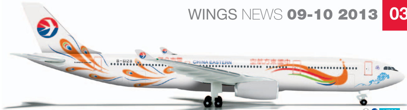
526081 M 1/500 26,00 €

Qantas Boeing 737-800 „2013 Lions Tour“ – VH-VXG Alle vier Jahre wird eine All-Star Rugbymannschaft unter dem Banner der British and Irish Lions zusammengestellt, die dann zu Test- und Freundschaftsspielen tournt. Im Sommer 2013 führt diese Tour nach Hong Kong und Australien. Qantas ist dabei der offizielle Sponsor der Lions. / Every four years, an All-Star-Rugby team is combined under the banner of the British and Irish Lions which then tours to trial and exhibition games. In summer 2013, this tour leads to Hong Kong and Australia. Qantas is the official Lions tour sponsor.