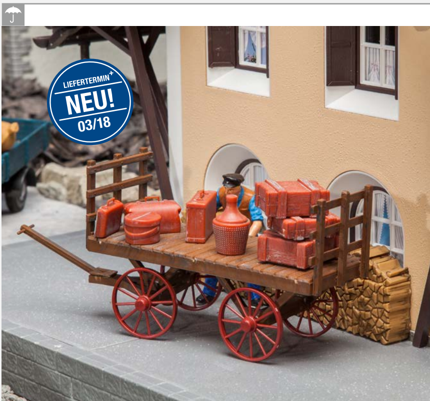
331610 190 x 55 x 80 mm · 7.5 x 2.2 x 3.2 inch