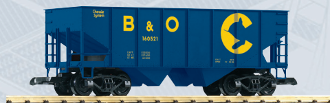
38882 Schüttgutwagen Chessie - B&O 160521 75,50 €*