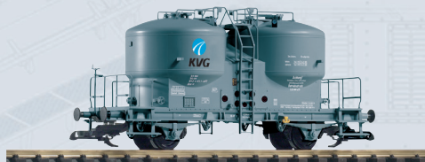
37793 Zementsilowagen KVG Ep. V 140,00 €*