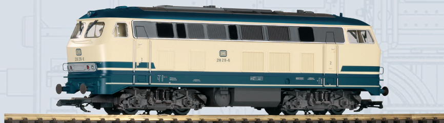
37509 Diesellokomotive BR 218 DB Ep. IV