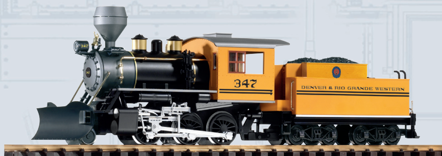
38225 D&RGW Dampflokk 347 mit Tender „Mogul“ Die Lok ist bereits mit Sound- und Dampffunktion ausgerüstet.