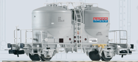
54696 Zementsilowagen NACCO Ep. V