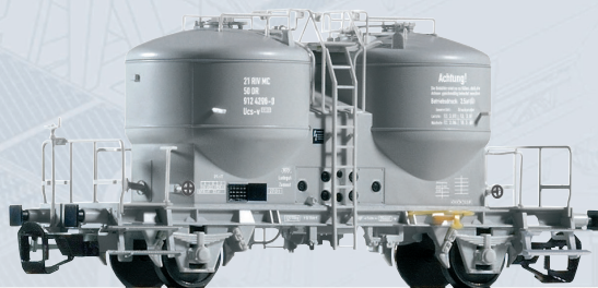
47754 Zementsilowagen DR Ep. IV