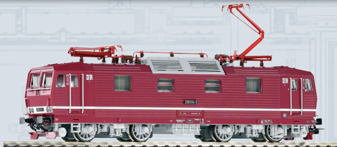
51060 Elektrolokomotive BR 230 DR Ep. IV