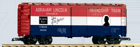
38885 Kühlwagen CB&Q Friendship Train 75,50 €*

* unverbindlich empfohlener Verkaufspreis