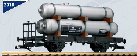
37831 Behelfskesselwagen DB Ep. III 140,00 €*