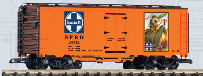
38895 Kühlwagen SF „Warrior Chief“