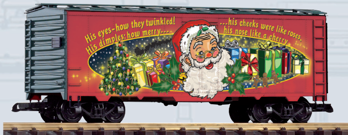
38894 Weihnachtswagen 2019