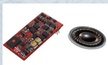
46445 PIKO SmartDecoder 4.1 Sound für TT Elektrolok Vectron BR 193

Der PIKO SmartDecoder 4.1 Sound ist ein universell einsetzbarer Digitaldecoder der neuesten Generation mit 8-Kanälen und 12 bit Sound, vielfältigen Lichtausgängen und einer 1,2 A Motorsteuerung. Er beherrscht die Datenformate DCC mit Rail-ComPlus®, Motorola® und Selectrix®, ist mfx-fähig und kann auch auf analogen Anlagen eingesetzt werden. Der im Lieferumfang enthaltene Lautsprecher ist speziell auf den jeweiligen Loktyp abgestimmt.