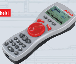
35017 G Navigator 2,4GHz

Die Digital-Komponenten #35017 Navigator 2,4GHz und #35018 Funkempfänger 2,4GHz ersetzen die Artikel #35011 und #35012. Weitere Informationen finden Sie unter www.piko.de .