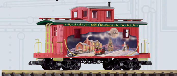
38897 Güterzugbegleitwagen Weihnachten