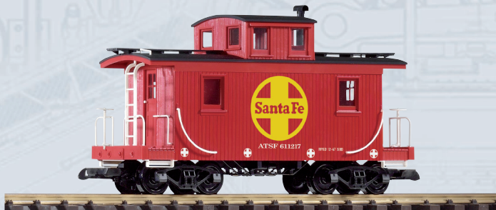
38896 Güterzugbegleitwagen SF