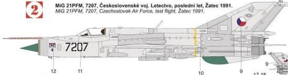
MiG 21PFM, 7207, Československé voj. Letectvo, poslední let, Žatec 1991. MiG 21PFM, 7207, Czechoslovak Air Force, last flight, Žatec 1991.