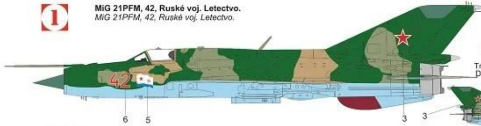
MiG 21PFM, 42, Ruské voj. Letectvo. MiG 21PFM, 42, Ruské voj. Letectvo.