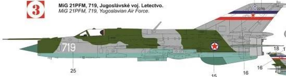
MiG 21PFM, 719, Jugoslávské voj. Letectvo. MiG 21PFM, 719, Yugoslavian Air Force.