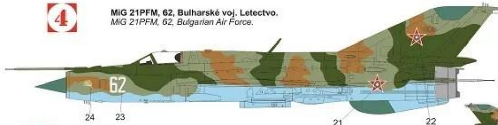
MiG 21PFM, 62, Bulharské voj. Letectvo. MiG 21PFM, 62, Bulgarian Air Force.